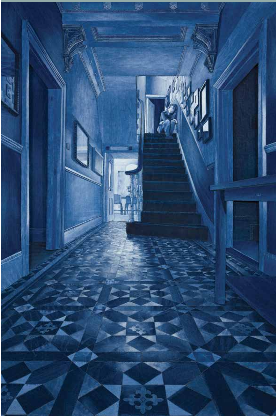
Ian Berry. Splendid Isolation

Ian Berry, Behind Closed Doors, 2016, denim, 122 x 180 cm. Collectie Graham Edwards