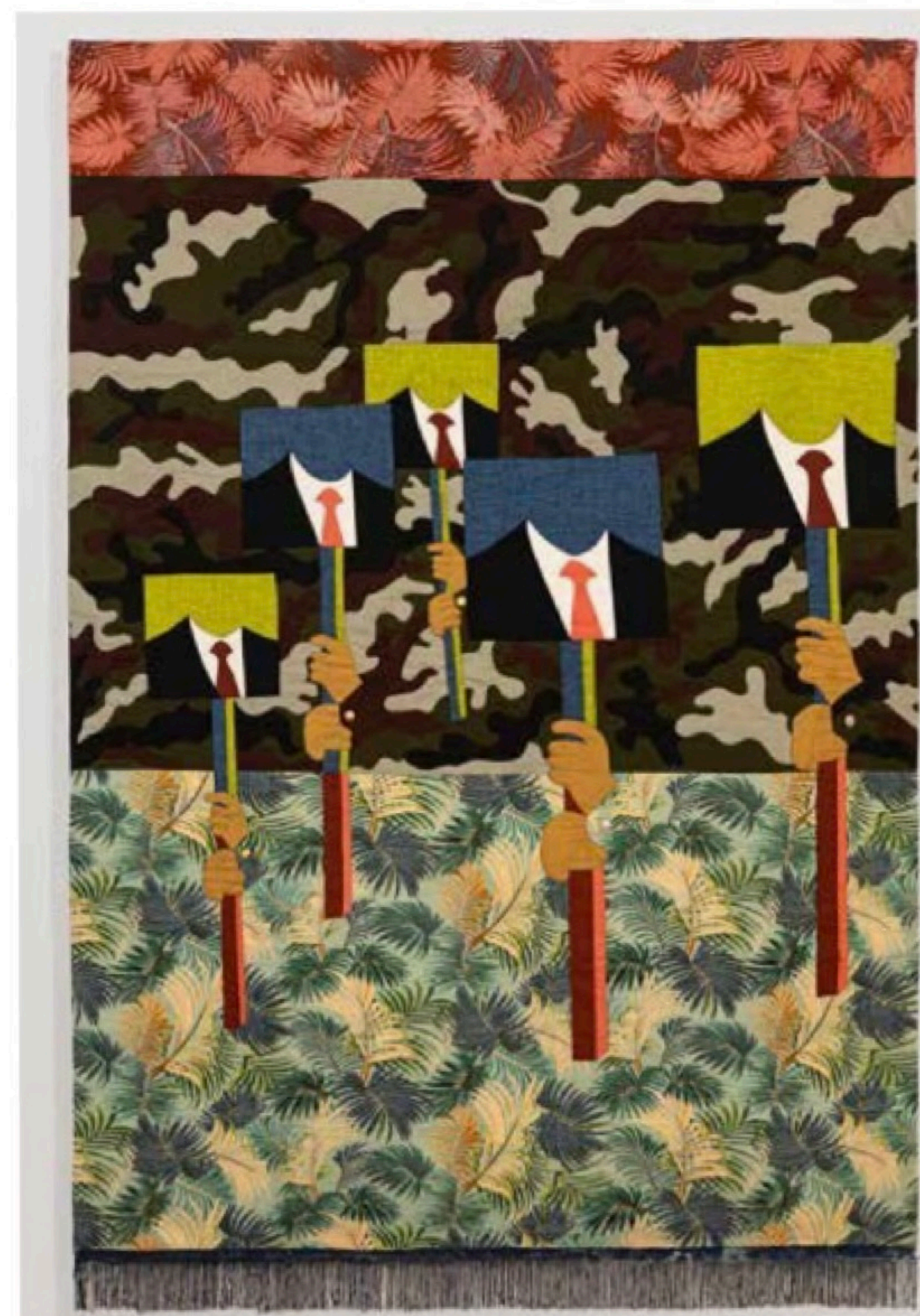
Dina Danish, 'Army of Protestors' (2024).

gemaakt, soms laat ze het uitvoeren door ambachtslieden uit Caïro die gespecialiseerd zijn in het maken van decoratieve tenten (khayamiya). Effen stoffen worden gecombineerd